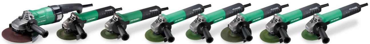
AC ブラシレスモーター搭載「電子ディスクグラインダシリーズ」