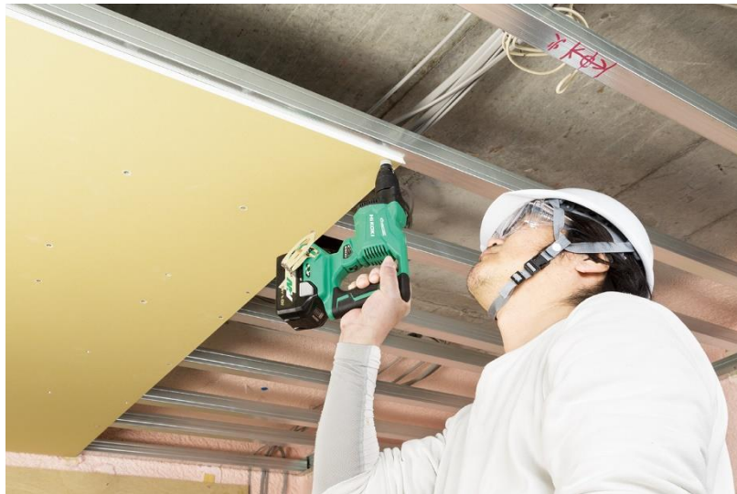
当製品の作業イメージ

工機ホールディングスは、今後もコードレスの機動性にパワフルさを兼ね備えたマルチボルトシリーズのラインアップ拡充を図ってまいります。