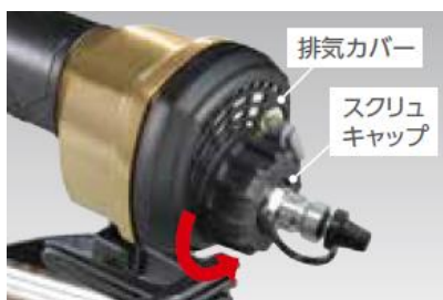
らくらくマフラ交換

オイル分離構造により、効率よくオイルを吸着し、オイルの飛散を減らしています。また、スクリュキャップを回すだけで排気カバーの取り外しを可能にしたため、マフラの交換が工具を使わず簡単にできます。さらに、付属の専用工具を使って、現場でも本体を分解せずにビットを交換することができます。