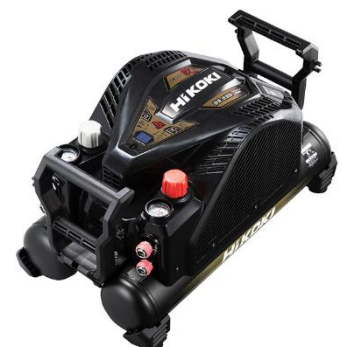
EC 1445H3 (CTN)

「EC 1445H3 (CTN)/(CS)/(CN)」は、当社従来製品 ※5 から振動を80%低減させ ※6 、トップクラス ※7 の低騒音を実現したエアコンプレッサです。エアコンプレッサから発生する騒音を気にすることなく、快適に作業できます。