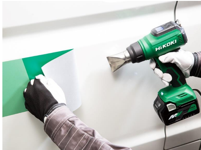
当製品の作業イメージ

※2 ノズル(丸)(コード No.378685 ¥600)、ノズル(曲面)(コード No.378686 ¥600)、ノズル(平面)(コード No.378687 ¥600)