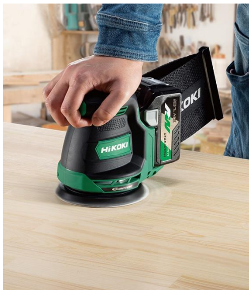
当製品の作業イメージ

工機ホールディングスは、今後もコードレスの機動性にパワフルさを兼ね備えたマルチボルトシリーズのラインアップ拡充を図ってまいります。