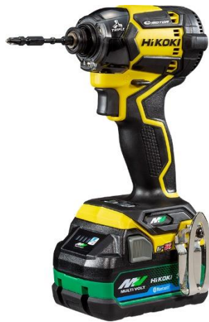
デザートイエロー