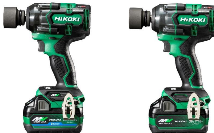
(左から) WR 36DH/WR 18DH